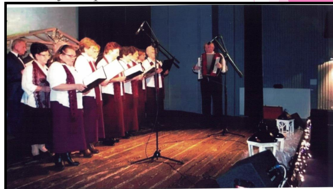
Gminne Centrum Kultury, Sportu i Turystyki w Godowie